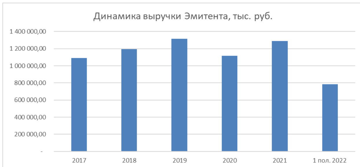
График динамики выручки (с 2017 г. до 2021 г.) прекрасно демонстрирует положительную динамику роста выручка Компании ООО «СОБИ-ЛИЗИНГ».

Выручка Компании ООО «СОБИ-ЛИЗИНГ» сформирована на 100% за счет лизинговых услуг: